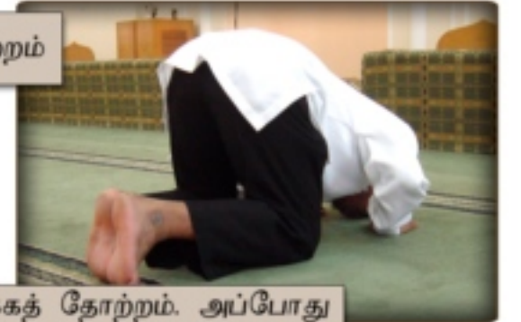
7 ஸுஜாதின் பின்பக்கத் தோற்றம். அப்போது கால்விரல்கள் வைக்கப்படும் முறை