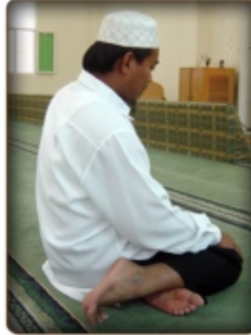
12. தவ்ருக் அமர்வு படம்