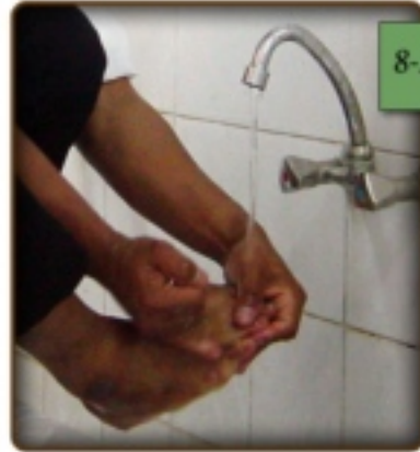
8-A வலது காலைக் கழுவும் படம்