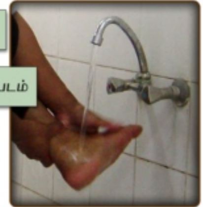
8-B இடது காலைக் கழுவும் படம்