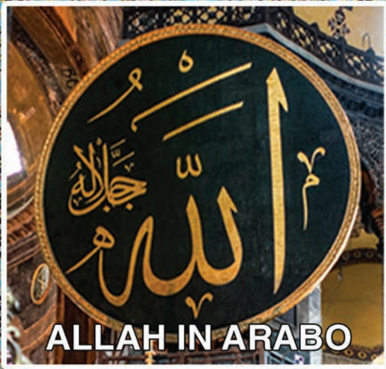
ALLAH IN ARABO