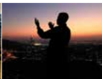
アッラーに祈りを 捧げるイスラム教徒