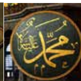
「モハンマド」 アラビア語で