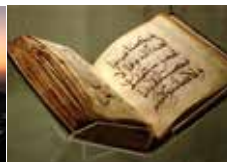
偉大なるコーラン