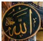
「アッラー」 アラビア語で

モスク（マスジド） ：イスラム教徒が主に祈りと礼拝のために使用する穢れのない清らかな所のこと。